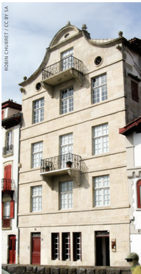
Ravelen jaiotetxea, Ziburuko kostaldean.

Antzezlan horixe izan daiteke 10-Emakume perfektua pelikulako Bo Dereken eta Dudley Mooreren eszenaren oinarria, inoiz halakorik esplizituki onartu ez bada ere. ●